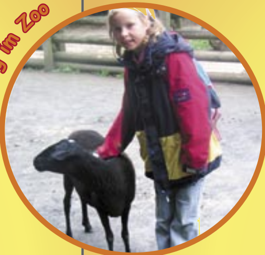
Ein Tag im Zoo