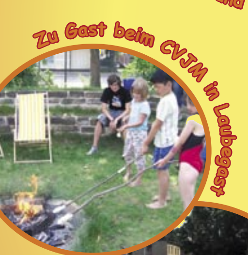
Zu Gast beim CVJM in Lambegast