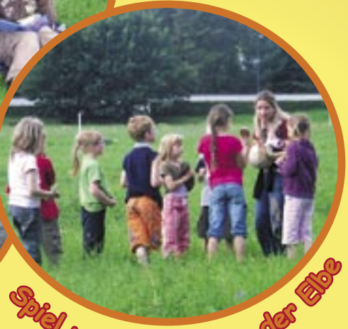
Spiel und Picknick an der Elbe