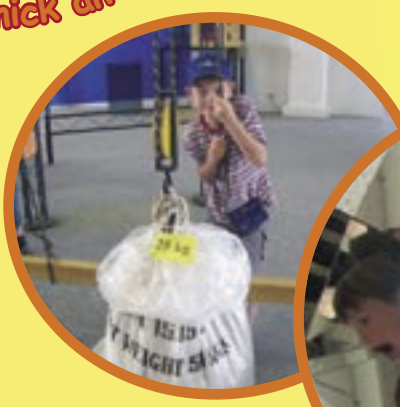
Experimentieren im Museum