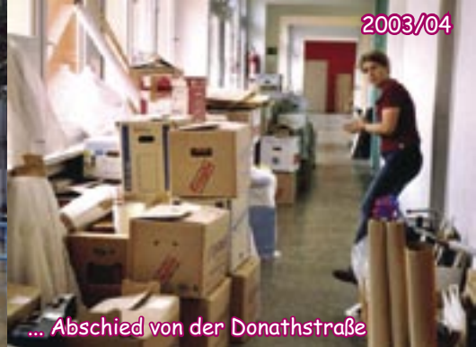
... Abschied von der Donathstraße