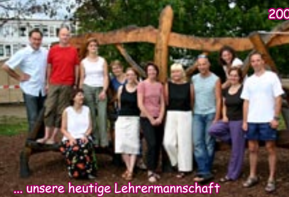
... unsere heutige Lehrermanschaft