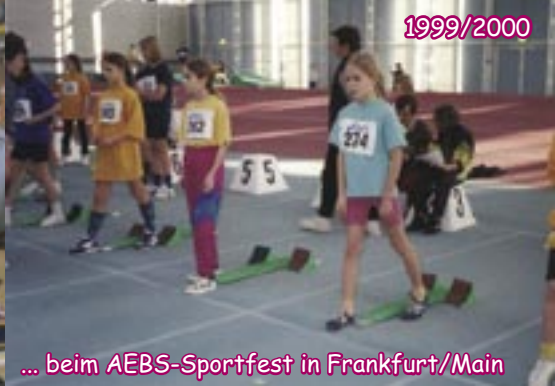
... beim AEBS-Sportfest in Frankfurt/Main