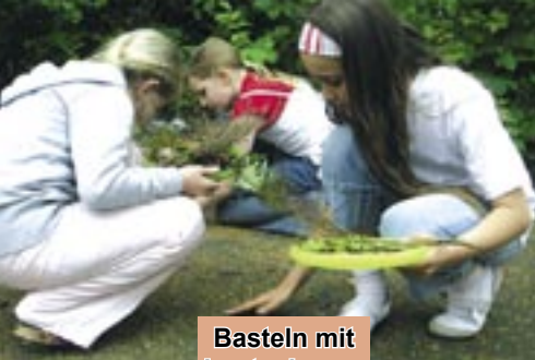
Basteln mit kostenlosem Material