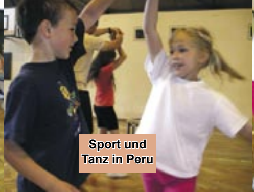
Sport und Tanz in Peru