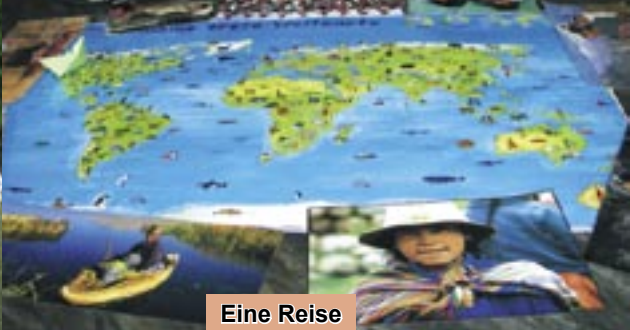
Eine Reise durch Peru