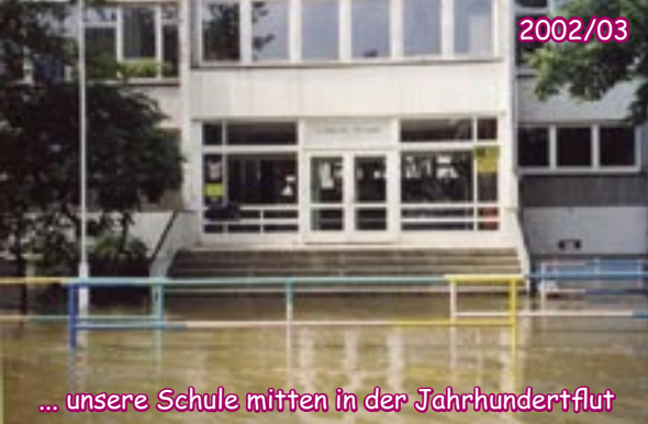
... unsere Schule mitten in der Jahrhundertflut