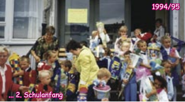
... 2. Schulanfang