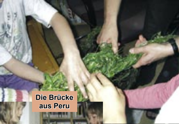
Die Brücke aus Peru