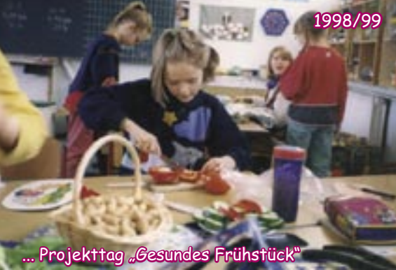
... Projekttag „Gesundes Frühstück“