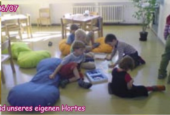
... Start der Mittelschule und unseres eigenen Hortes