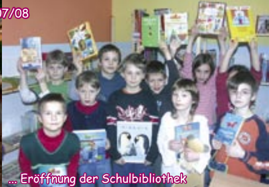
... Eröffnung der Schulbibliothek