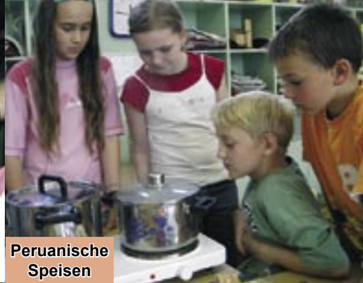
Peruanische Speisen kochen und kosten