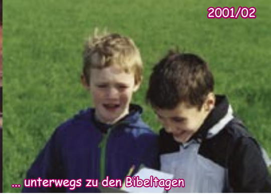
... unterwegs zu den Bibeltagen