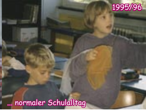
... normaler Schulalltag

auf 75, die FES veranstaltet mit der Kita „Zwitschernest“ ein großes Benefizkonzert 2008 – wir feiern 15 Jahre FES, der Standort Hausdorfer Str. 4 wird unser „Zuhause“ Diese Schilderung ist ein unvollständiger, subjektiver Rückblick. Viele wichtige Personen, Fakten und Ereignisse bleiben ungenannt. In allem entdecke ich jedoch, wie unser Gott und himmlischer Vater seine Zusage