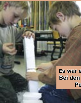
Es war einmal ... Bei den Inkas in Peru