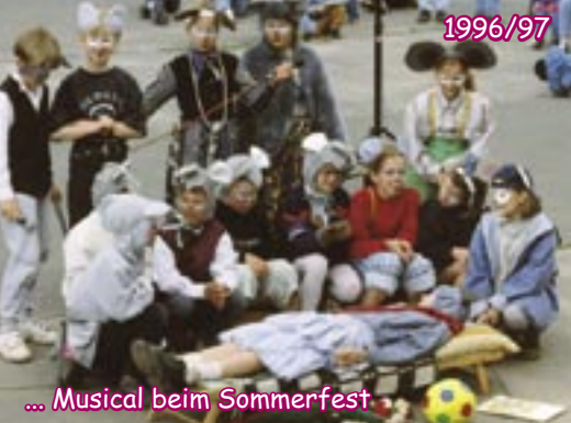
... Musical beim Sommerfest