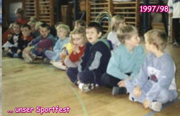
... unser Sportfest